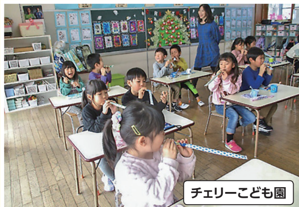
チェリーこども園