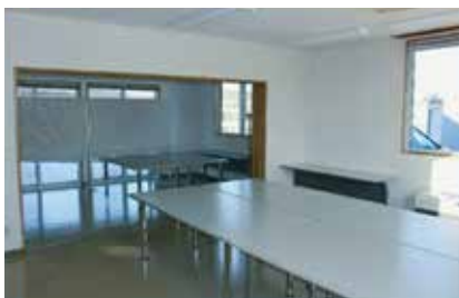
体験実習室①（手前） 体験実習室②（奥）