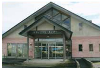
ドライフラワーセンター 外観写真