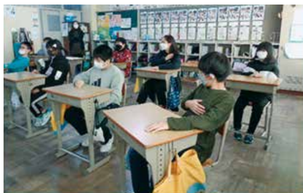
授業の様子（講師はカメラでリモート中継中です）