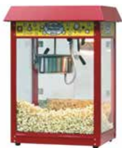
ポップコーン製造機

各団体やサークル、町内会や子ども会等のイベント、交流会での催し物で活用できるレクリエーション用品を無料で貸出しています。事前予約と申請書類の提出が必要となりますので、まずはお電話にてお問い合わせください。