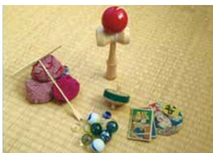
昔の遊び（けん玉、お手玉等）