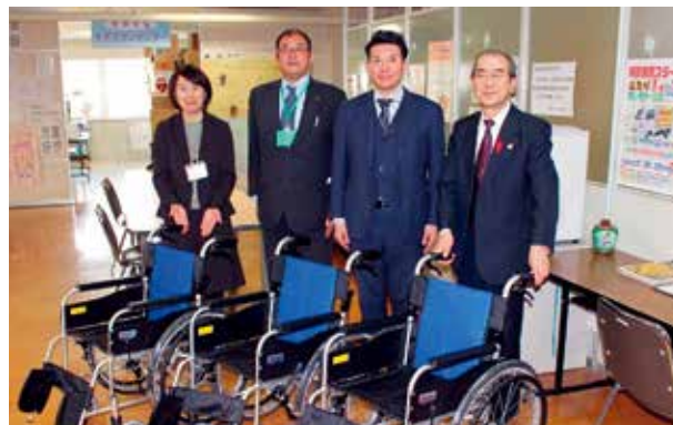
株式会社トヨタレンタリース青森 様