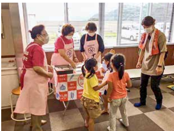
4歳児健康相談で減塩の普及啓発