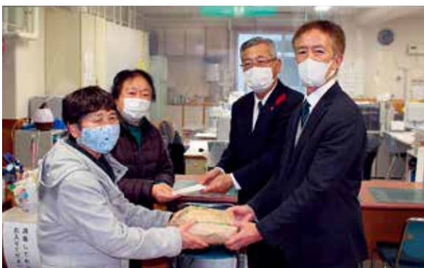
立正佼成会八戸教会 三戸支部様