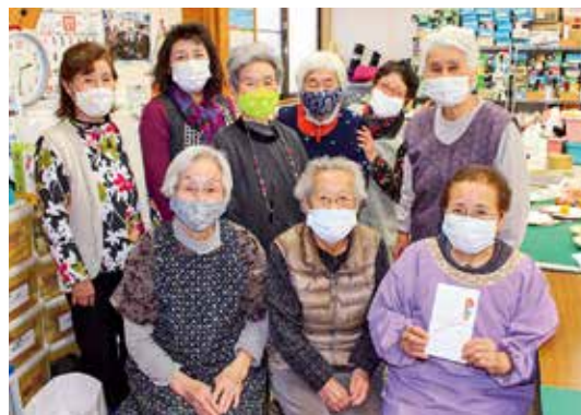
手づくり趣味の会やすらぎ 様