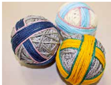
次回の作品（みほん）