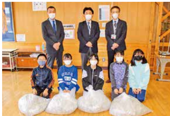
南部町立杉沢小学校 様