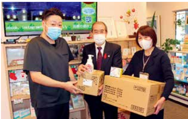
イナムラ歯科医院 様