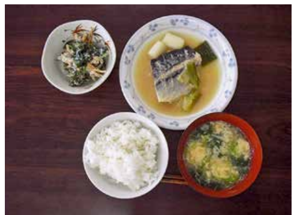
男性のための料理教室にて調理