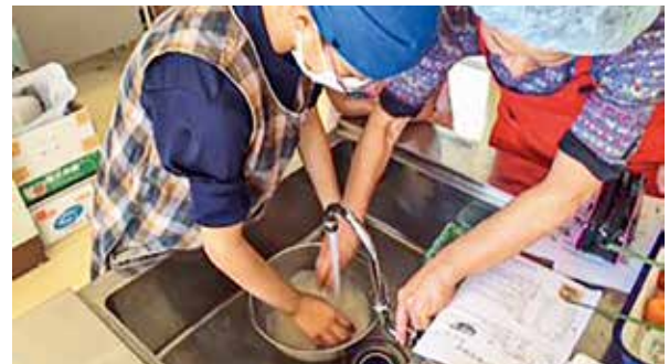
小学校での食育教室② お米のとき方の体験

令和3年度の会員は80名。会員数は年々減少傾向にあるため、一緒に活動できるメンバーを募集しています。自分や家族の健康のために、お友達に誘われて、仲間づくりに、ボランティア活動に興味があってなど、きっかけはそれぞれです。