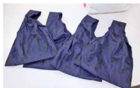
手作りエコバッグ