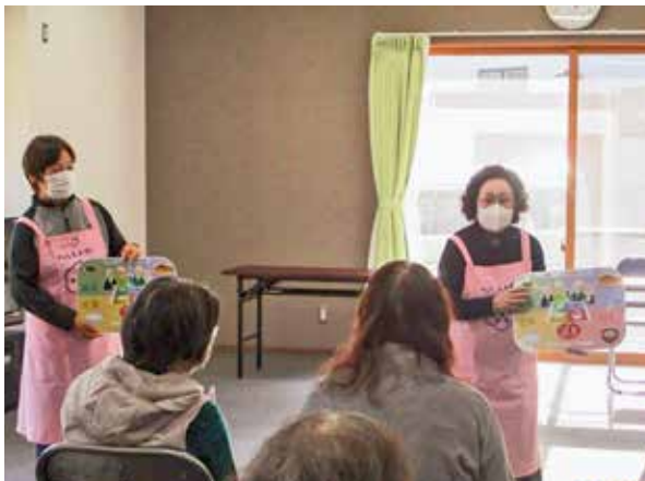
高齢者を対象とした講話の様子「低栄養予防のための食事について」

今年度は、開催時間を短縮し、資料やサンプルの配布という形で活動を少しずつ再開しました。食生活改善のための普及活動の場ではありますが、住民の方とのふれあいの場になり、会員も元気をもらいながら活動しています。