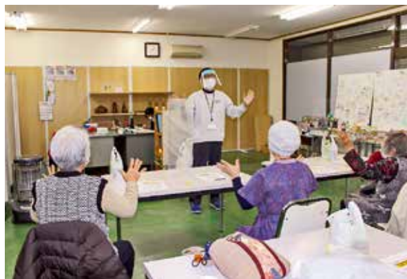
手指を動かしながら頭の体操

「帰り道も気を付けて」とお互いに気を配り合いながら帰路についた参加者のみなさんでした。