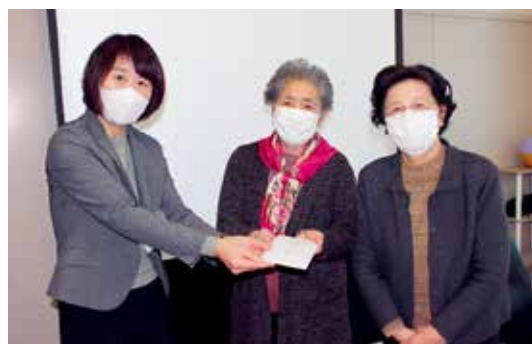
南部地区婦人会 様