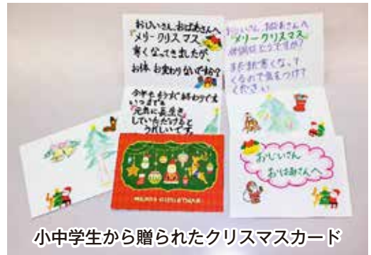
小中学生から贈られたクリスマスカード

12月のクリスマスの時期に合わせて、民生委員児童委員のみなさんが80歳以上のお一人暮らしの方にクリスマスカードを届けました。赤十字奉仕団の活動の一環として毎年行われており、町内の小中学生が書いてくれたクリスマスカードは、高齢者の皆さんにとっても喜ばれています。