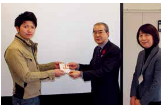
有限会社大坊建設 大友会 様