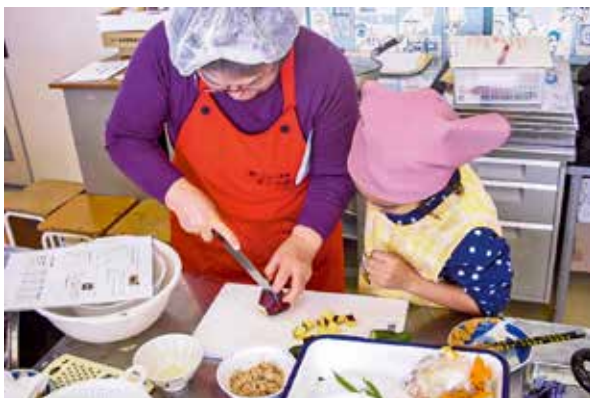
小学校での食育教室① 野菜の切り方の学習

「食生活改善推進委員会」と聞くと、難しそうなイメージを持つ方が多いようですが、会員同士で協力しあい、できる時にできる人が、無理なく活動しています。