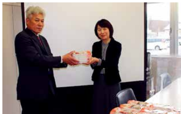
三戸ライオンズクラブ 様