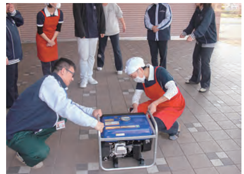
発動発電機は、名川老人福祉センターおよび剣吉デイサービスセンターにそれぞれ1台配備しました。

また、デイサービスセンターひろば・デイサービスセンターあじさいの2事業所が、高齢者や要配慮者の二次的避難場所となる「福祉避難所」の協定を南部町と締結しており、飲料水やアルファ米、毛布等の備蓄品を中長期的に整備、増強しております。