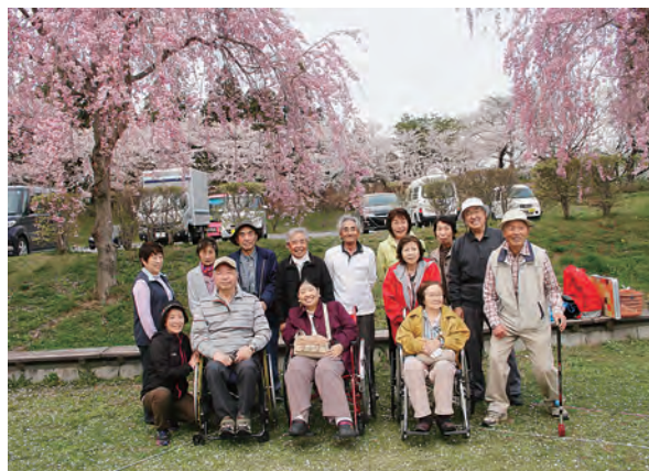
写真は、平成28年4月26日（火）開催「リフレッシュ交流会」（三戸町城山公園）での集合写真です!!

南部町身体障害者福祉会事務局(南部町社会福祉協議会内) TEL.0178-76-2662