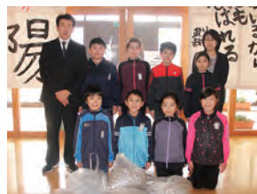
南部町立福地小学校 環境委員会 様