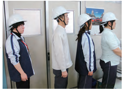
第一義的に非常参集する職員にヘルメットを貸与し、要配慮者等の安否確認活動の安全性を確保します。

南部町社会福祉協議会は、平成28年4月1日付けの人事異動で各事業所新体制となりました。それに伴い、非常災害時の緊急連絡体制や職員参集基準、参集場所の見直しを行いました。特に、災害によって交通が寸断した場合の職員参集場所を新たに定め、4月18日から4月20日の3日間にかけて、社会福祉協議会全職員対象に伝達研修を行いました。