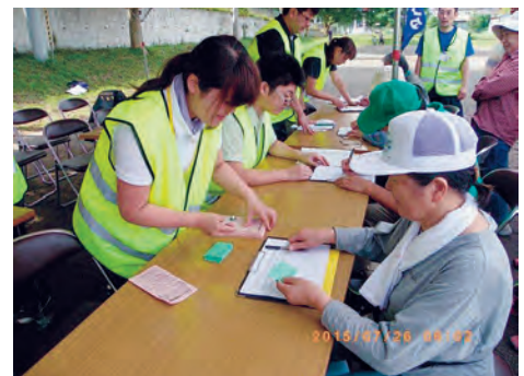
災害ボランティアセンターでは、ボランティア受付、被災者からのニーズ聞き取りを行います。

日頃から、行政や民生委員児童委員協議会、ボランティア活動者の方々等関係機関とのつながりを強化しながら、災害ボランティアセンター運営マニュアルの整備や必要資機材の整備を行っています。